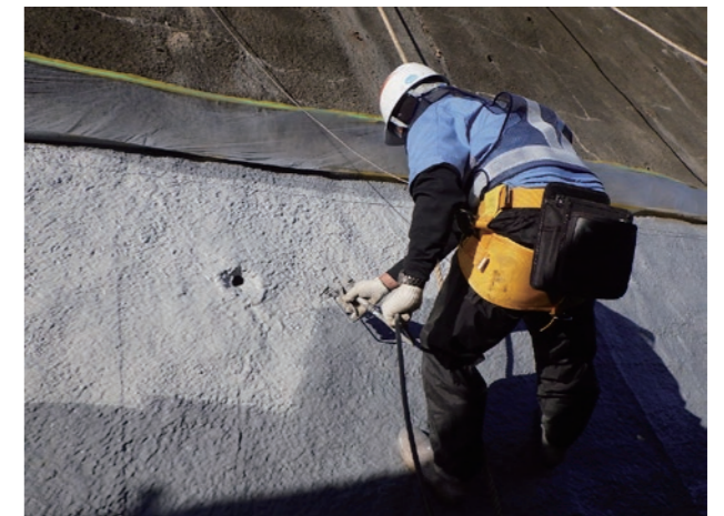
トップコート吹付工