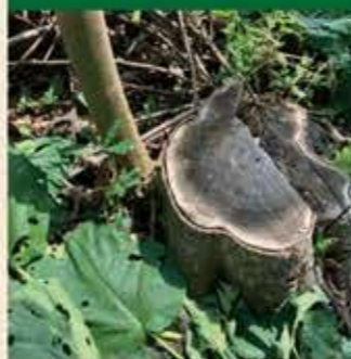
切り株から再発芽