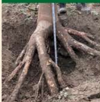
根張りの強い早生日本桐