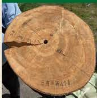
4~5年で直径40cm程度の成木