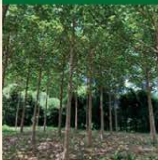
防火樹帯による予防保全対策