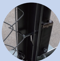
③支柱側の溝に引っ掛けた扉のフックを外すだけで簡単です。