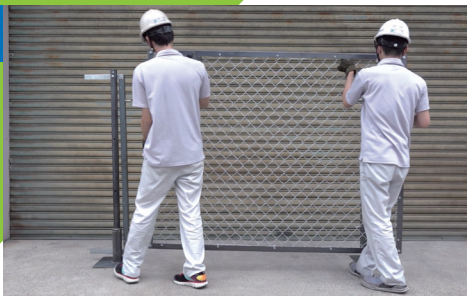
①カギを外し、扉を上へスライドします。